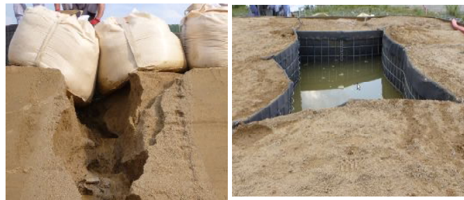
浸水防止性能の確認試験状況