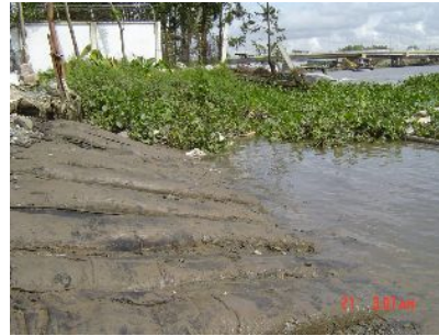
施工後 18 か月後の状態