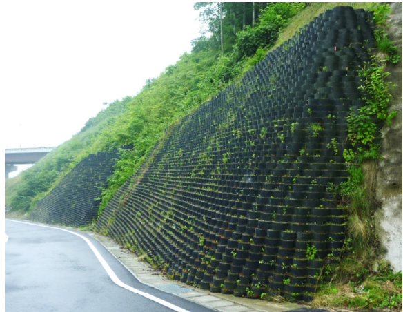
テラセル擁壁 (切土のり面補強)