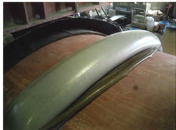
Eバッグ (裏込め注入完了状況)