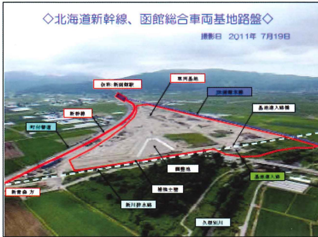
函館車両基地全体概要