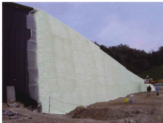
発泡ポリウレタンの吹き付け完了