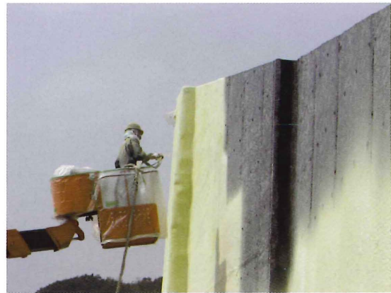
発泡ポリウレタンの吹き付け状況