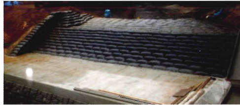
土嚢を用いたため池の補強事例