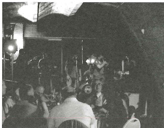
図-2 Conference Dinner