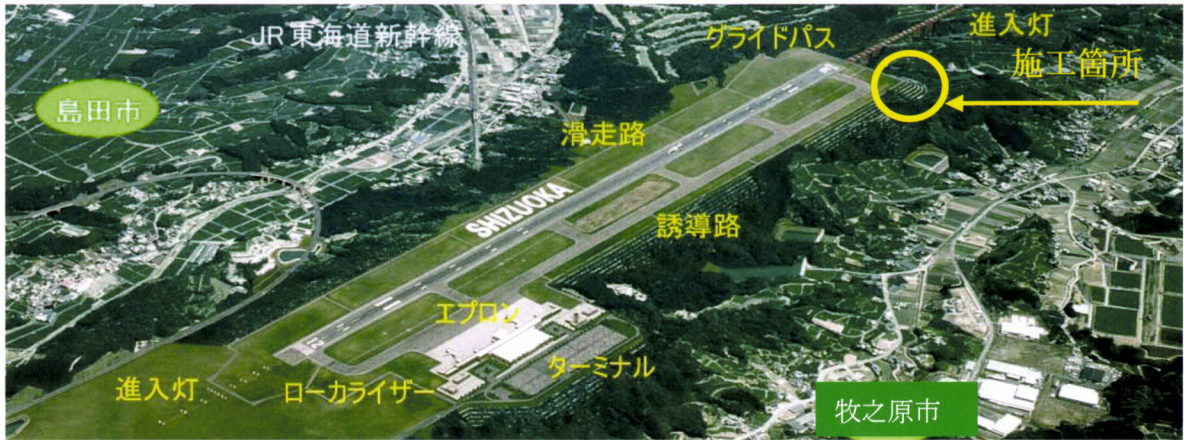
空港完成予想図及び施行位置