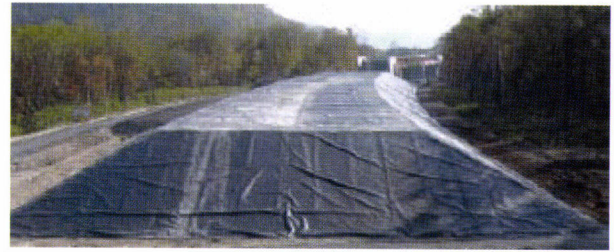
法面・天端の遮水シートの敷設状況