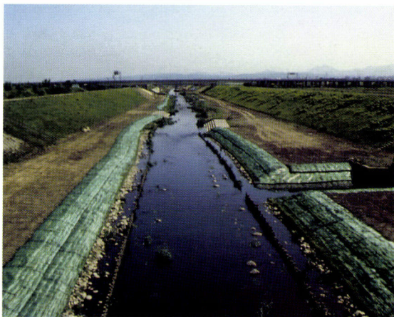
北海道、月寒川での施工例(施工後1ヶ月)