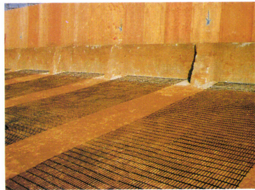
施工状況ネステム敷設図