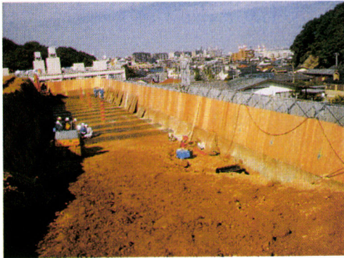
施工状況ネステム敷設図