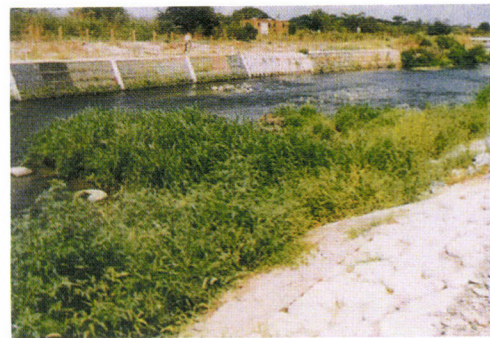
施工4ヶ月後(平成12年8月)