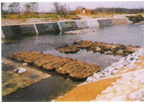
施工直後(平成12年4月)